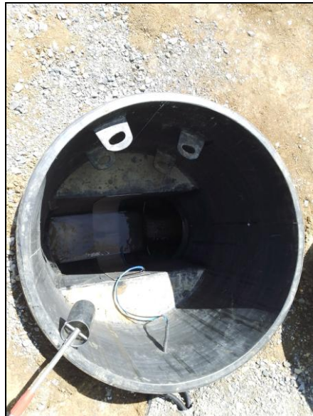
Slika 1. Mesto uzorkovanja: Šaht u koji je ugrađen merač protoka